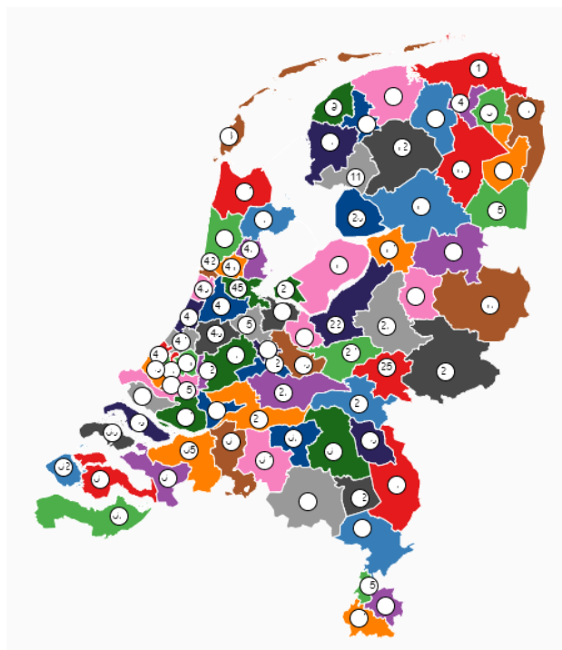
Figuur 1 Kaart streekomroepen

AI Mediagroep denkt dat de vorming van streekomroepen het juiste antwoord is op het veranderende medialandschapen behoefte van de kijker/luisteraar. Het is mede omdat die reden dat de omroepen van Barneveld en Nijkerk gefuseerd zijn en het behalen van het keurmerk streekomroep de ambitie is voor de komende jaren. Vanuit het masterplan van de NLPO is het de bedoeling dat AI nieuwe samenwerkingen aangaat met andere omroepen om te komen tot voldoende schaalgrootte.