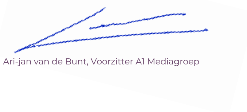
Ari-jan van de Bunt, Voorzitter A1 Mediagroep

Onze ambitie is -en blijft- om uit te groeien tot een volwaardige streekomroep die nieuws en mooie verhalen brengt uit onze gemeenten!